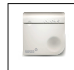
Vocht en CO 2 RF bediening